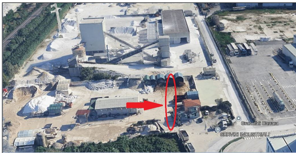
Relitto stradale in vendita in Via Antica Massa snc, località "Gottara"

Il bene oggetto di vendita è un terreno sito in località "Gottara", nel Comune di Carrara, in Via Antica Massa snc. Link diretto per le indicazioni con Google Maps: https://maps.app.goo.gl/wTZ5qX8qwfSta5sw9 (coordinate geografiche: 44.0429 N 10.0781 E).